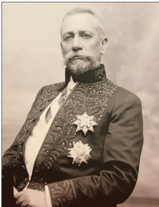
I. Albert herceg