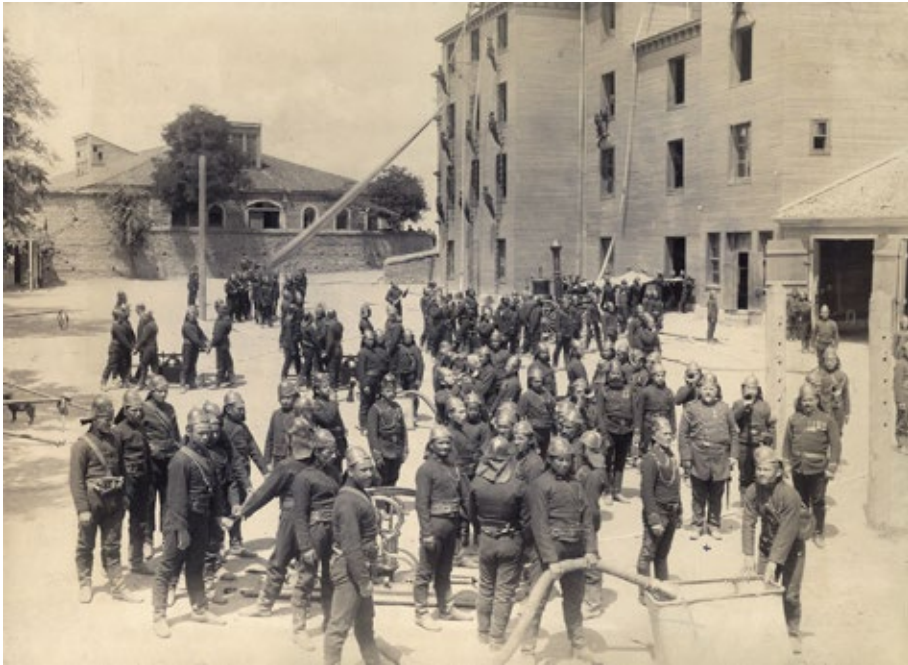
6. számú kép: Konstantinápolyi tűzoltók gyakorlata