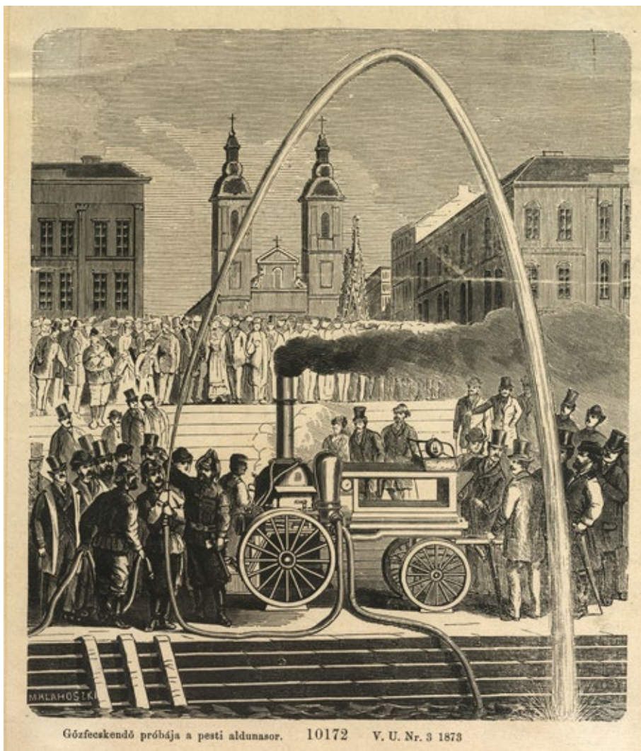
5. számú kép: A Széchenyi Ödön által vásárolt gőzfecskendő próbája az Eskü téren (1873).