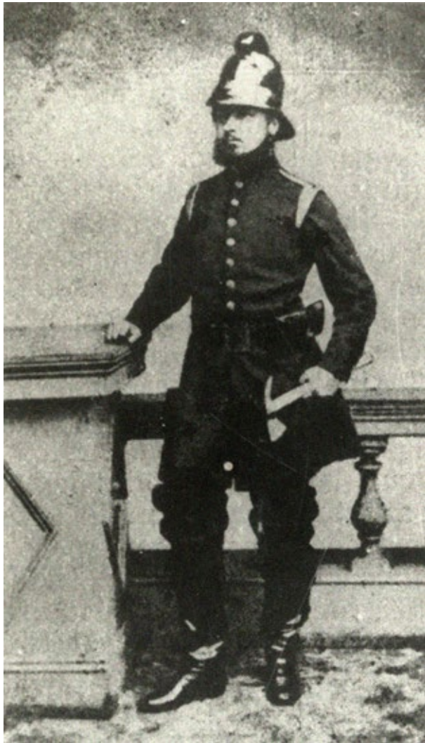
1. számú kép: Széchenyi Ödön, mint londoni tűzoltó (1862)