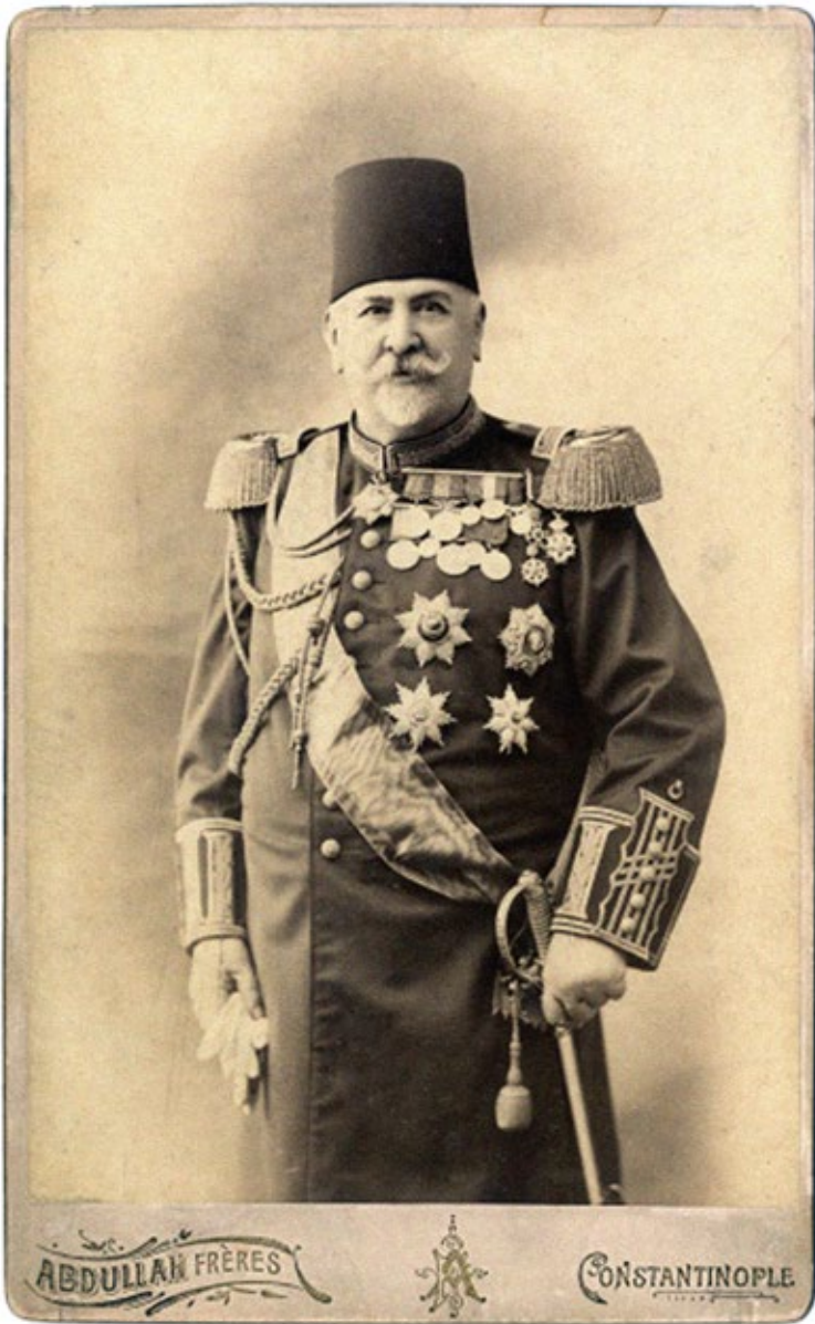
7. számú kép: Széchenyi, a tűzpasa