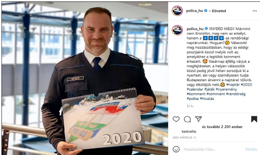
3. számú ábra: Gál Kristóf, az ORFK szóvivője

A bejegyzés létrehozásának időpontja 2020. március 11., ami már a koronavírus magyarországi megjelenési időpontja után készült (3. számú ábra). Gál Kristóf az Operatív Törzs tagjaként az Instagramon való szereplést átmenetileg vagy sem, de abbahagyta, hiszen napi szintű, sokszor erőn felüli teljesítménye a közösségi oldalon való szereplést már nem tette lehetővé. Ennek ellenére az általa hirdetett naptár a beérkező kommentek száma alapján a vizsgált időszak egyik legnépszerűbb bejegyzése volt. Személyes hírneve, elismertsége eddig sem volt kérdés, ezután azonban vitathatatlan.