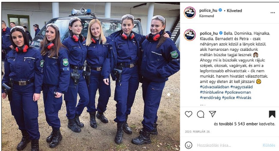
2. számú ábra: Rendőrhölgyek

A bejegyzés dátuma 2019. február 26., a fényképen hat fiatal rendőrhölgy látható egyenruhában (2. számú ábra). A kép eredetileg a Zsaru Magazinban jelent meg, amelyet felhasználásra kértek az oldal kezelői és posztolták. A bejegyzéshez több mint 5500 kedvelés és nagyjából 200 komment érkezett. A hölgyek keresztnévvel és arccal is vállalják az általuk választott foglalkozást, egyértelműen kiemelik és elismerik a rendőri hivatás népszerűsítését, melyet nemcsak munkaként, hanem hivatásként definiálnak. Külön érdekesség a „család” szó használata a bejegyzés szövegében, amely egy metafora. A szervezetet a bejegyzés létrehozója a társadalmi élet legszorosabb kötelékéhez hasonlítja, melylyel egyik alapvető célja „az egy család vagyunk” érzés erősítése a hivatásos állomány körében.