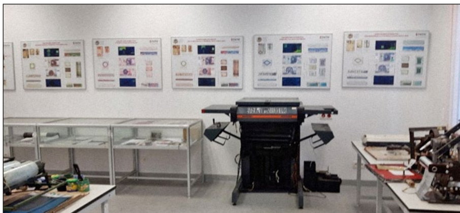
6. számú ábra: „Okmány- és pénzhamisító műhely”, Szczytno.