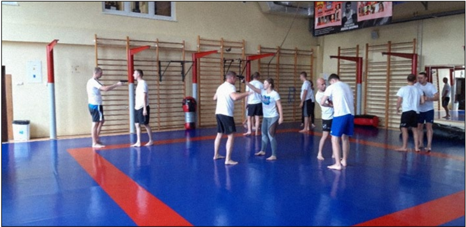
3. számú ábra: Önvédelmi foglalkozás, Szczytno.