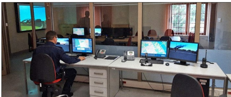
7. számú ábra: A vezetésirányítási szimulációs központ irányítóterme, Szczytno.