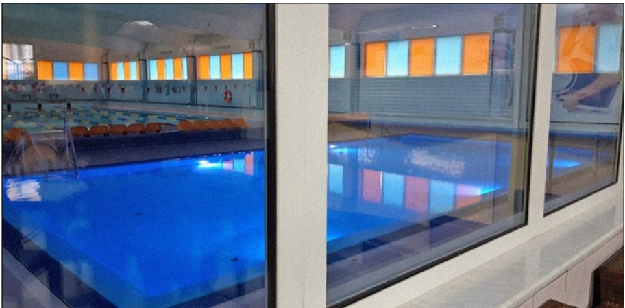
4. számú ábra: Uszoda, Szczytno.