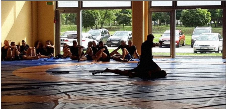
1. számú ábra: Intézkedéstaktikai „témazáró” vizsga, a támadó földre vitele, megbilincselése egyedül, Legionowo.