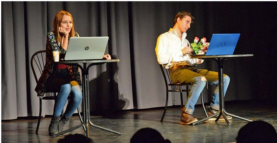
Forrás: Pest Megyei Rendőr-főkapitányság Bűnmegelőzési Osztály munkatársai által készített előadásfotó – „Hálózat-On” című előadás.

Az előadást követően interaktív előadás formájában beszéltek át a meghívott diákokkal a darabban is megjelenő online követés, a selfitis jelenség problémáit. A darab az internetes bűnözést, az interneten elkövethető bűncselekményeket