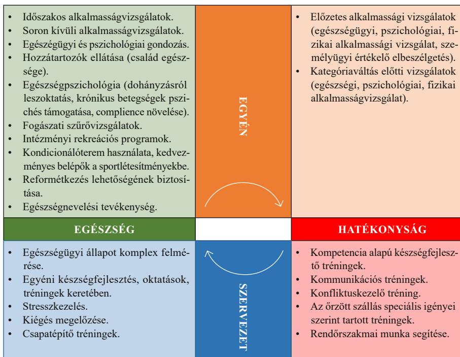
4. számú ábra: Szabolcs-Szatmár-Bereg Megyei Rendőr-főkapitányság egészségfejlesztése Malét-Szabó tevékenységi alapmodell rendszerében

Mint ahogy a fentiekből látszik a Szabolcs-Szatmár-Bereg Megyei Rendőr-főkapitányságon megvalósuló egészségfejlesztési program Segal programjának mindhárom elemét szem előtt tartva alakult ki. A benne szereplő egészségfejlesztési tevékenységek Malét-Szabó (2015) tevékenységi alapmodelljében gondolkodva a 4. számú ábra szerint vázolhatók fel.