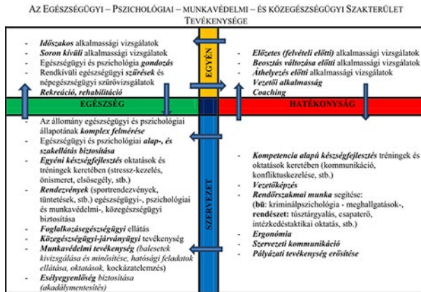
2. számú ábra: A rendőrség egészségfejlesztési programjai Malét-Szabó tevékenységi alapmodell rendszerében