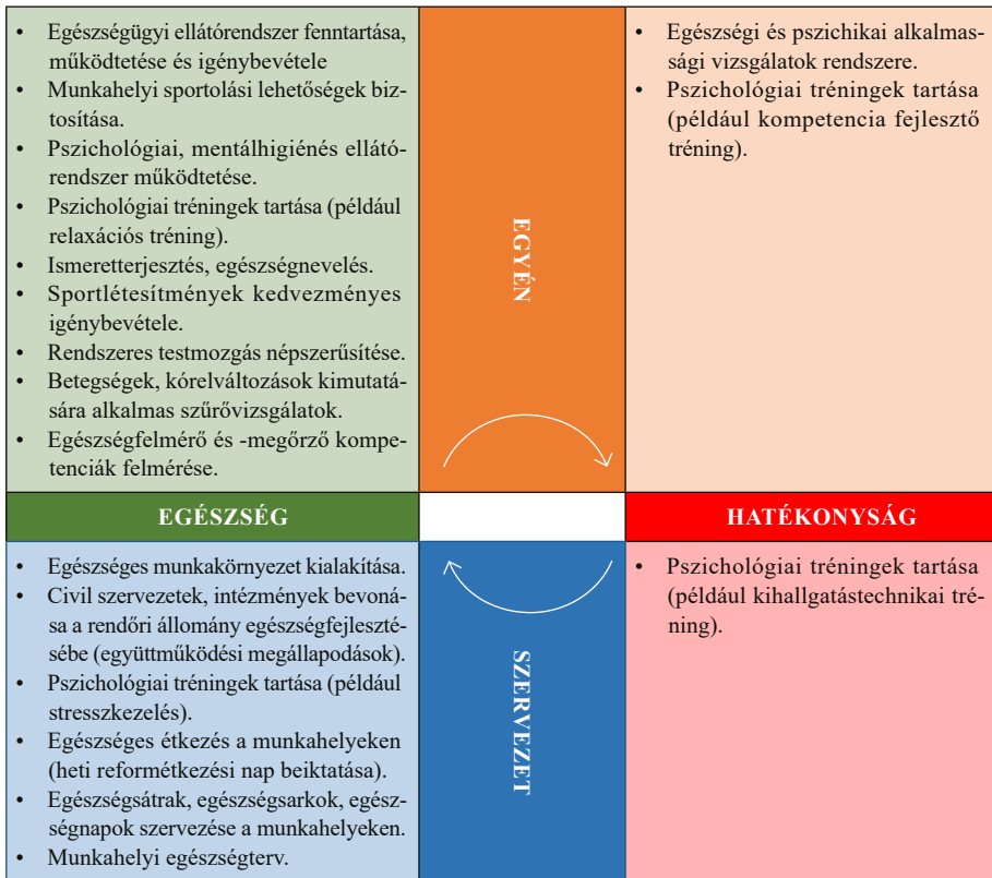
3. számú ábra: Az Élet-Erő-Egészség Program Malét-Szabó tevékenységi alapmodell rendszerében

A tevékenységi alapmodellben feltüntetve a program elemeit a következő ábra vázolható fel.