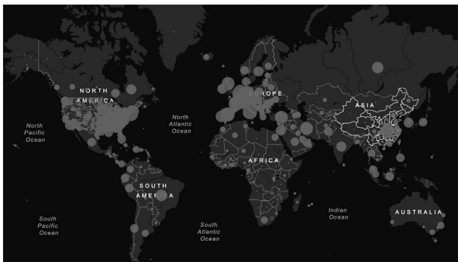
2. számú ábra: A koronavírus terjedése a világban (2020.04.13-i adat)

Mindeközben a világon (2020. április 13-án) 1.872.073 esetet diagnosztizáltak, 116.098 haláleset került diagnosztizálásra koronavírus fertőzés következtében, és 1.821.149 tesztet végeztek el. A legtöbb haláleset Olaszországban (19.899), Spanyolországban (17.489) és Franciaországban (14.393) volt. Kiemelendő, hogy a legtöbb regisztrált beteg az USA-ban található (558.999), illetve csak New York városában 6.898 fő halálozott el a fertőzés következtében 7 (2. számú ábra).